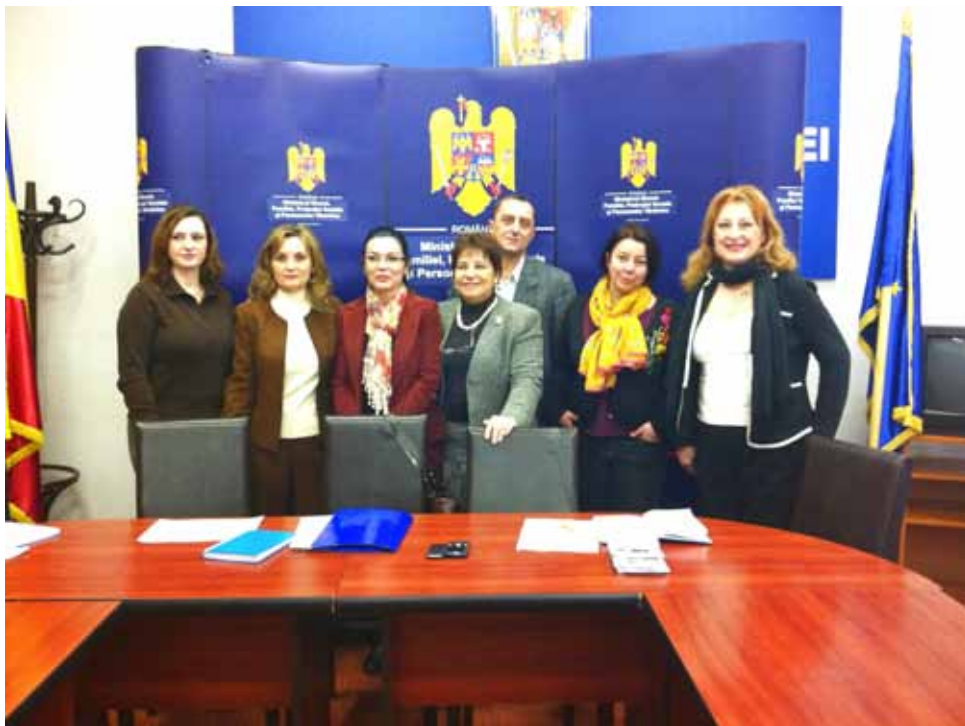
Imagine de la Masa Rotundă organizată de Ministerul Muncii în sprijinul proiectului Te iubește mama!

La discuții au participat reprezentanți ai MMFPSPV, ai Ministerului Educației Naționale (MEN), ai Associazione delle Donne Romene in Italia (A.D.R.I.), coordonatorii ANBPR-Biblionet, ai Comitato Italiano Associazione, ONG cu activitate în România, precum și bibliotecari cu experiență în