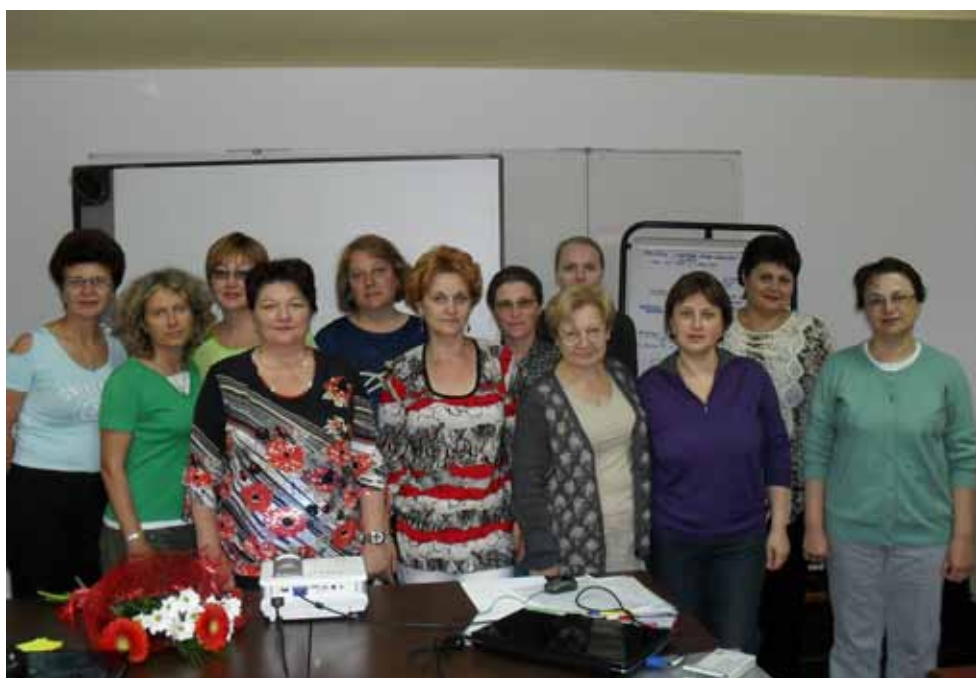
Lectorii și participanții la cursul de Statistică și evaluare

Așadar, departe de a fi doar un excurs teoretic, Cursul de Statistică și Evaluare a Activității de Bibliotecă a avut