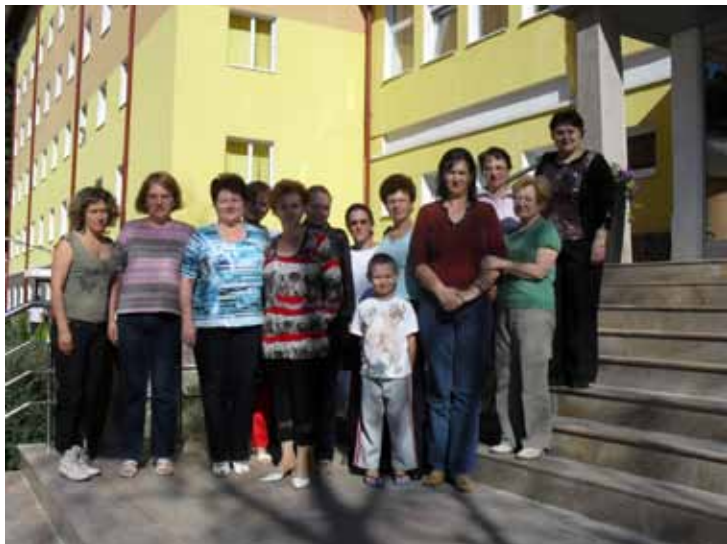
Moment de relaxare după sesiunile de curs