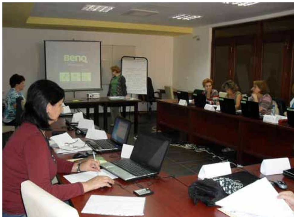
Lucru individual și pe grupuri, sub îndrumarea cordonatorului de formare al ANBPR

Biblioteca Județeană „Ștefan Bănulescu” Ialomița