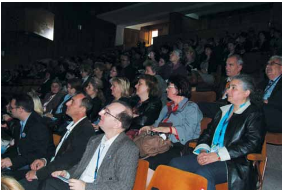
Imagine de ansamblu din sala de plen a Conferinței

Subînscrisă temei „Viitorul aparține bibliotecilor în schimbare”, Conferința de la Brăila a găzduit dezbateri tematice extrem de interesante și de mare actualitate: cât de importantă este activitatea bibliotecilor și a bibliotecarilor în contextul social actual, cât de important este modul în care se alocă sau nu fonduri pentru achiziția de carte și alte documente în colecțiile bibliotecilor, cum influențează pregătirea profesională a personalului calitatea serviciilor de bibliotecă, cât de deschiși sunt bibliotecarii din mediul rural față de utilizarea tehnologiei și cum resimt