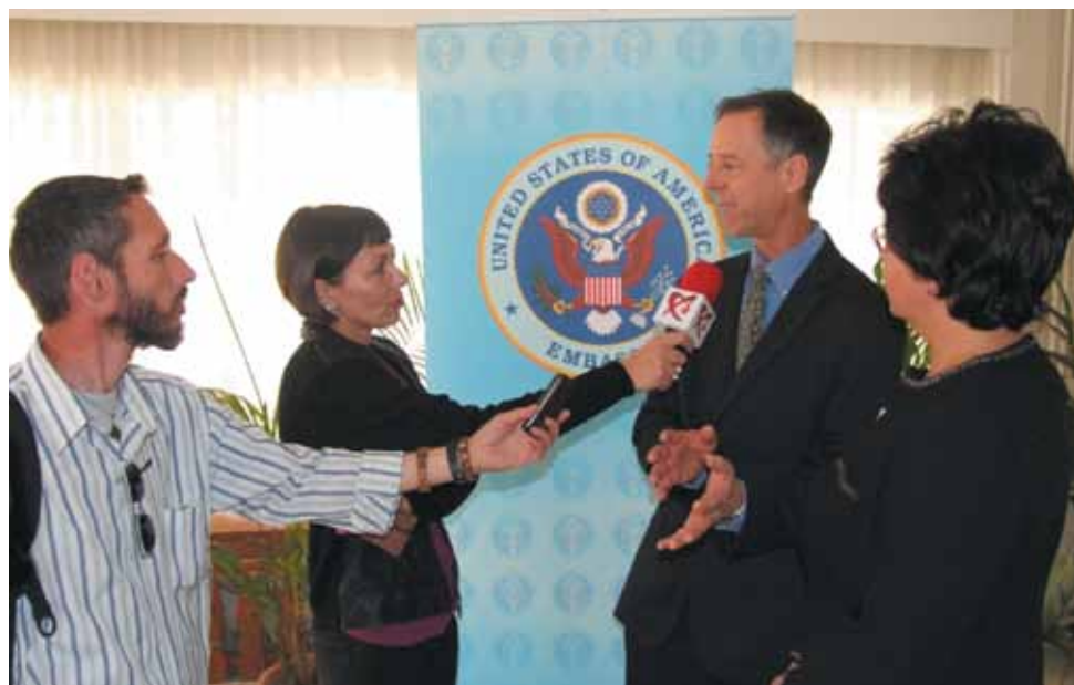
Bruce P. Kleiner, reprezentantul Ambasadei SUA la București, oferind declarații presei

Această conferință a fost preambulul unei noi etape de dezvoltare a Asociației și a suitemului românesc de biblioteci, care anunță noi acțiuni și proiecte semnificative pentru breasla bibliotecarilor.