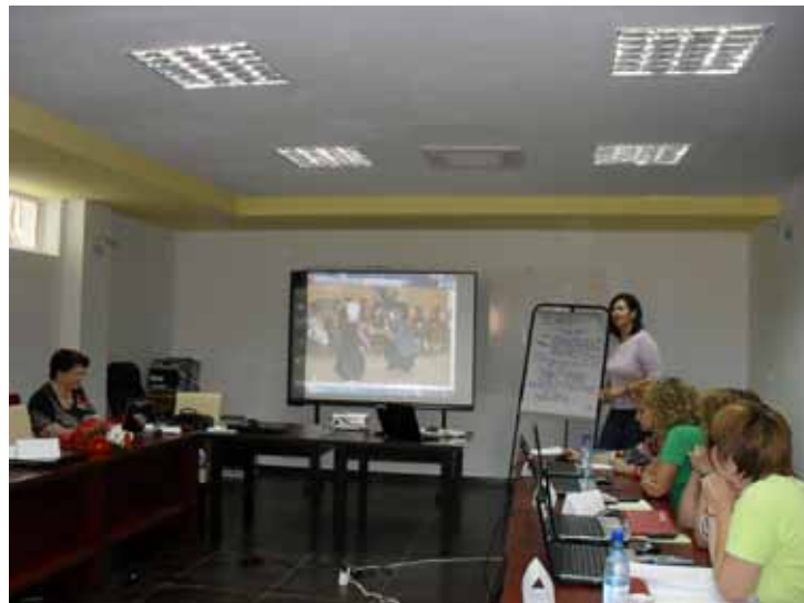
Imagine din timpul instruirii

darul de a dezvălui numeroase aspecte asupra cărora o analiză aplicată ar fi în măsură să ofere soluții la probleme ce aparent nu au legătură cu statistica. (ex.: Indicatorul „Satisfacția utilizatorului”).