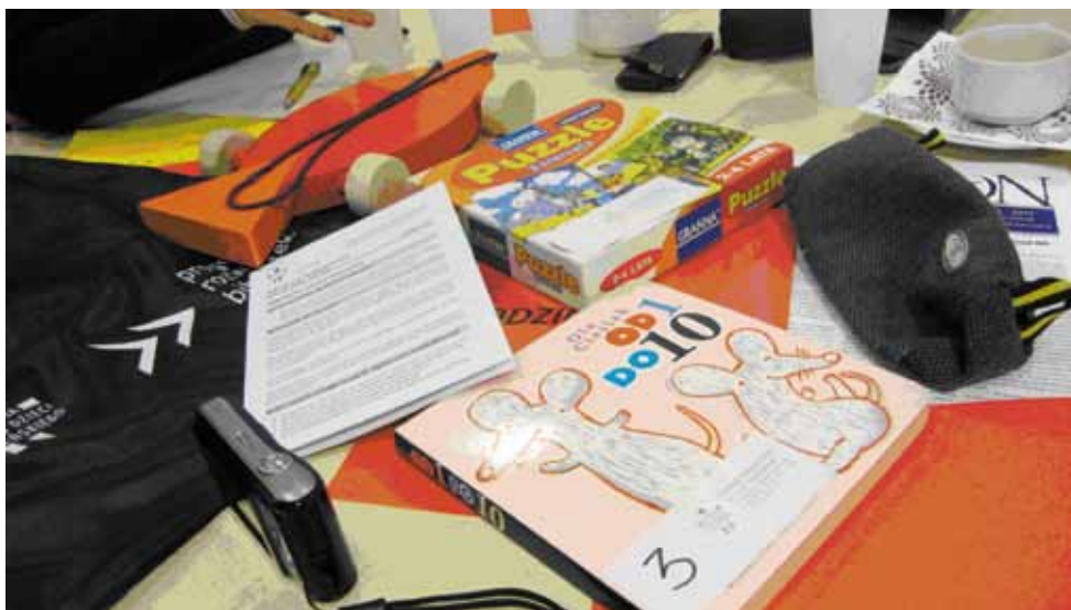
Un joc, o jucărie și o cărțică, pe baza cărora s-a dezvoltat proiectul Părinți și copii în bibliotecă

O astfel de campanie este "Hai pe net!", având ca scop incluziunea digitală și care își propune să aducă online cât mai mulți români. Se derulează la nivel european, este inițiată de Fundația EOS România în parteneriat cu telecentre, biblioteci, școli, PAPI și alte organizații dedicate alfabetizării digitale în România. Este susținută de Comisia Europeană, Microsoft, Liberty Global, Accenture și European Broadcasters Union. Anul trecut România se situa pe locul 3 cu