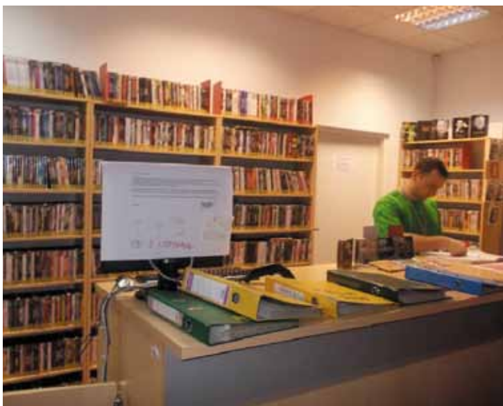
Biblioteca publică Jan Nowak-Jerozolimski, Varșovia