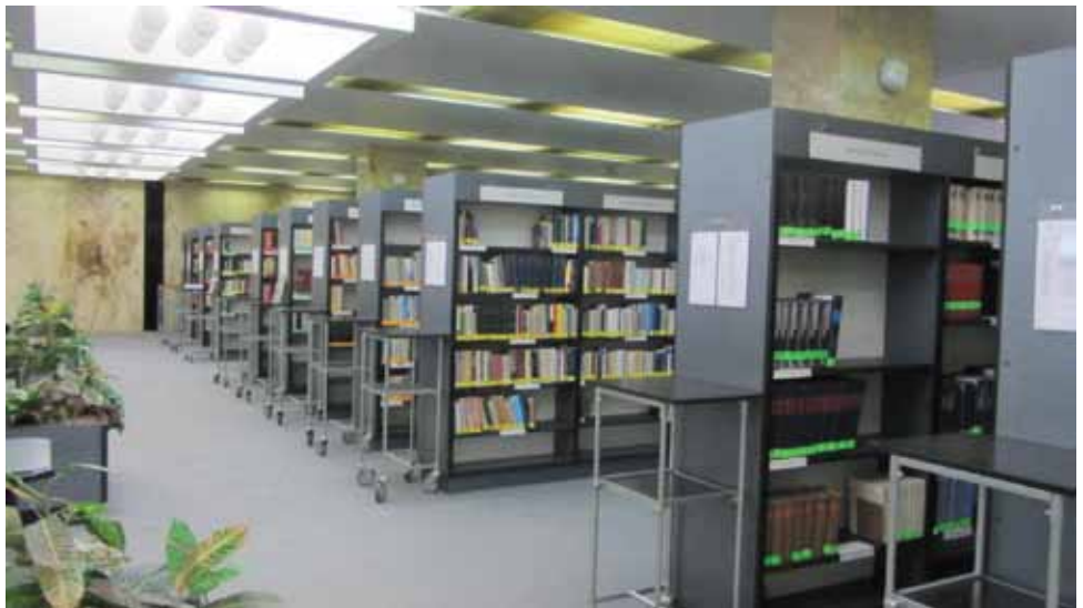
Biblioteca Națională a Poloniei, Varșovia

În mare parte derularea „Programului de Dezvoltare a bibliotecilor” (Program Rozwoju Bibliotek) din Polonia