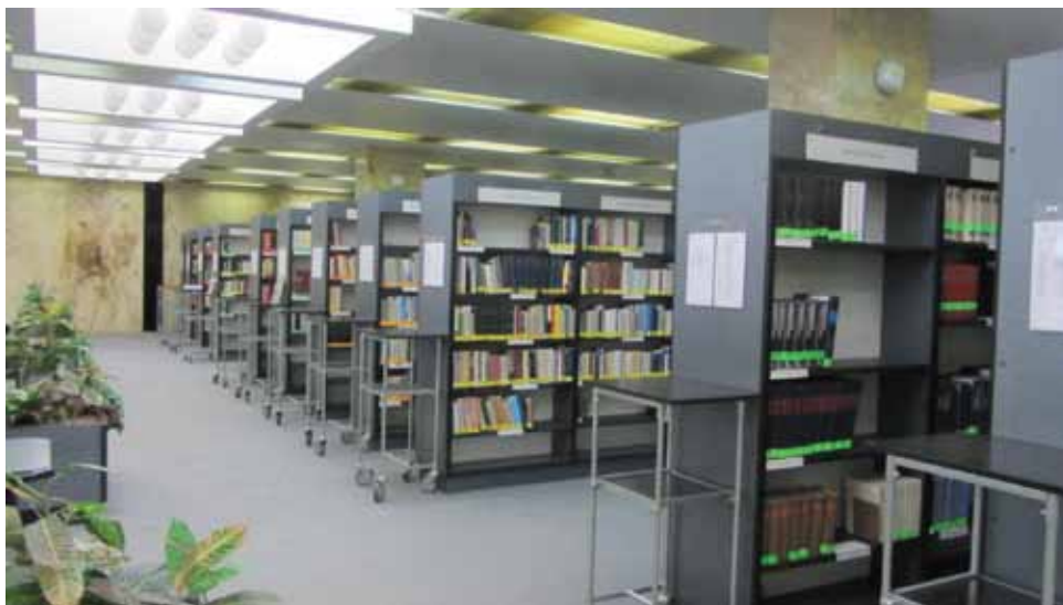
Biblioteca Națională a Poloniei, Varșovia

În mare parte derularea „Programului de Dezvoltare a bibliotecilor” (Program Rozwoju Bibliotek) din Polonia