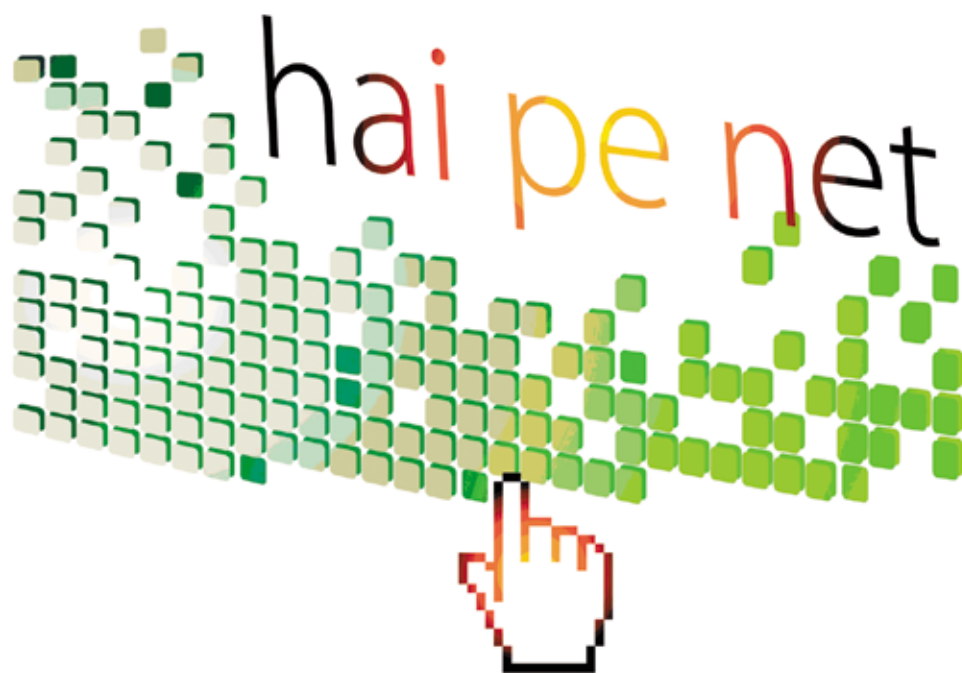
Logo-ul campaniei Hai pe net!

Centrul pentru Educație Cetățenească promovează cunoașterea civică, aptitudinile practice și atitudinile necesare construirii unui stat democratic bazat pe rolul societății civile și al legii. Această fundație își propune să aducă cetățenii în bibliotecile rurale inițiind activități bazate pe identitatea locală. În acest sens și-au propus să creeze o platformă de tip e-learning pentru bibliotecari, unde aceștia să învețe despre diferite subiecte cum ar fi: cineașterea, drepturile de autor, legislația poloneză referitoare