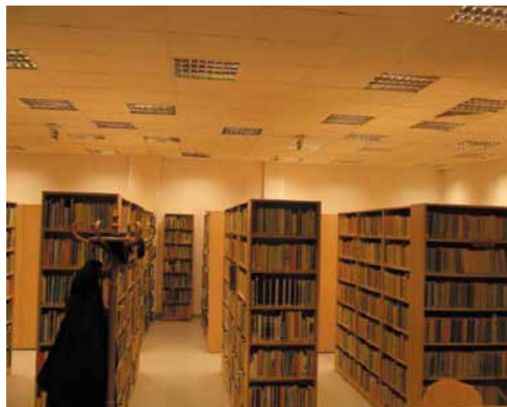
Biblioteca publică Jan Nowak-Jerozolimski, Varșovia - secția de împrumut