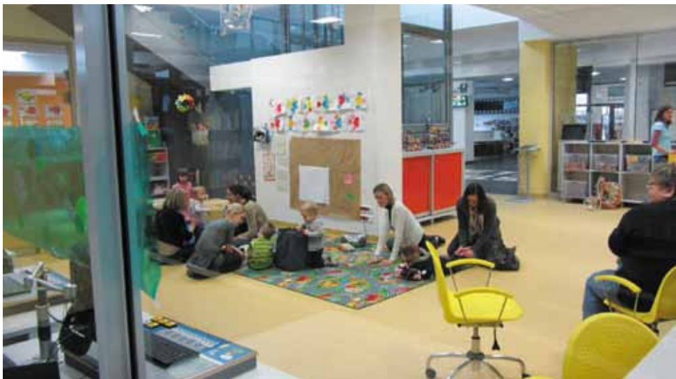
Mediateca Start-Meta din Varșovia, cartierul Bielany

de normalitate și de firesc am întâlnit-o în toate bibliotecile vizitate, iar entuziasmul, pasiunea și dăruirea bibliotecarilor polonezi ne-a copleșit, pe noi bibliotecarii români, și ne-au dat în același timp speranța că poate, urmând modelul lor, și biblioteca publică românească va putea să coaguleze în jurul ei, ca instituție de cultură, de educație, de formare, de promovare sau de petrecere a timpului liber, nevoile utilizatorilor din comunitățile deservite.