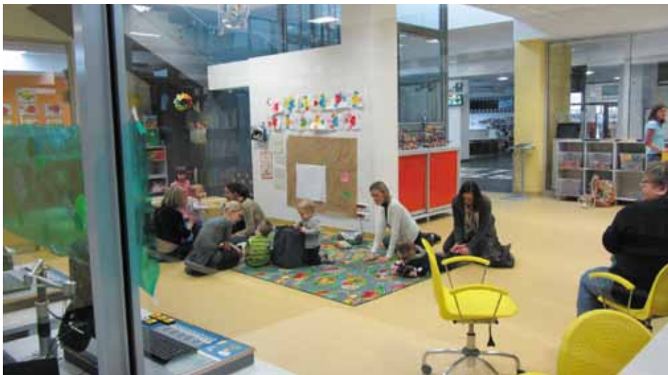
Mediateca Start-Meta din Varșovia, cartierul Bielany

de normalitate și de firesc am întâlnit-o în toate bibliotecile vizitate, iar entuziasmul, pasiunea și dăruirea bibliotecarilor polonezi ne-a copleșit, pe noi bibliotecarii români, și ne-au dat în același timp speranța că poate, urmând modelul lor, și biblioteca publică românească va putea să coaguleze în jurul ei, ca instituție de cultură, de educație, de formare, de promovare sau de petrecere a timpului liber, nevoile utilizatorilor din comunitățile deservite.