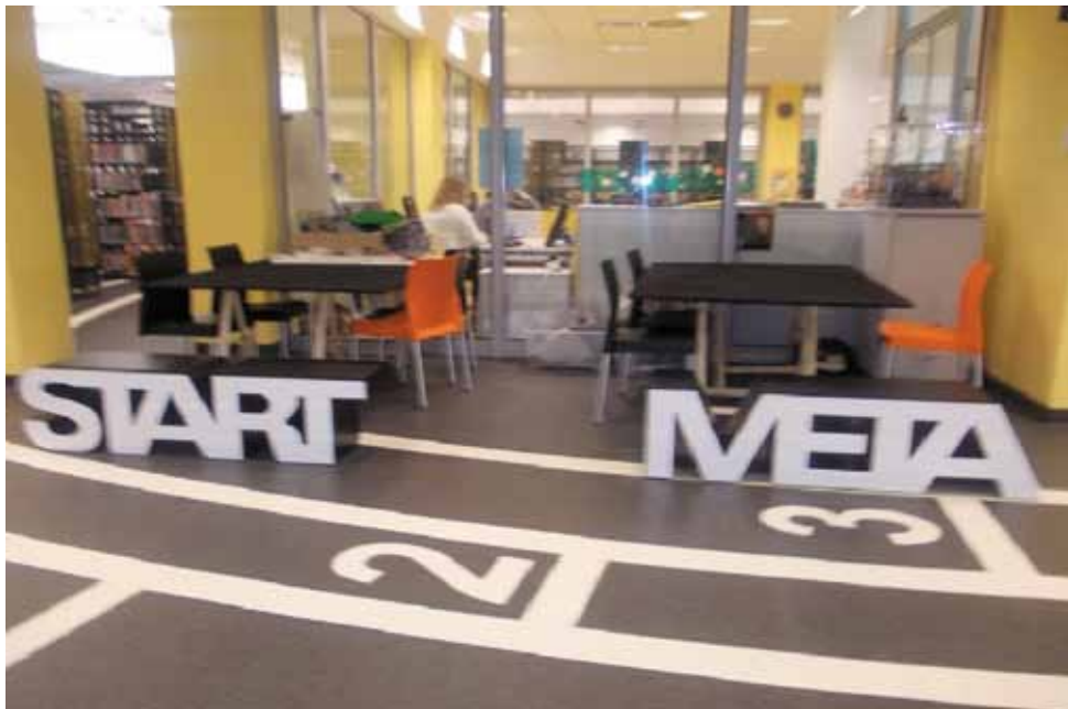
Mediateca Start-Meta din Varșovia, cartierul Bielany

de învățare prin experimentare. Un atelier de lucru pentru tineri și adulți în care se combină într-un mod modern învățarea limbilor străine, un laborator multimedia MultiArts capabil să nominalizeze cea mai mare artă grafică, unde fiecare își poate crea propriile piese și filme scurte și de animație. În laboratorul MultiMusic e ușor să se creeze muzica proprie, cu ajutorul instrumentelor multimedia conectate cu un sistem de calculator. MultiScience & Multitech permit elevilor să exploreze lumea roboticii. Multicentrum este un centru modern, computerizat de învățământ în care are loc învățarea prin joc. În cele cinci ateliere de lucru au avut loc diverse activități pentru copii și adolescenți.