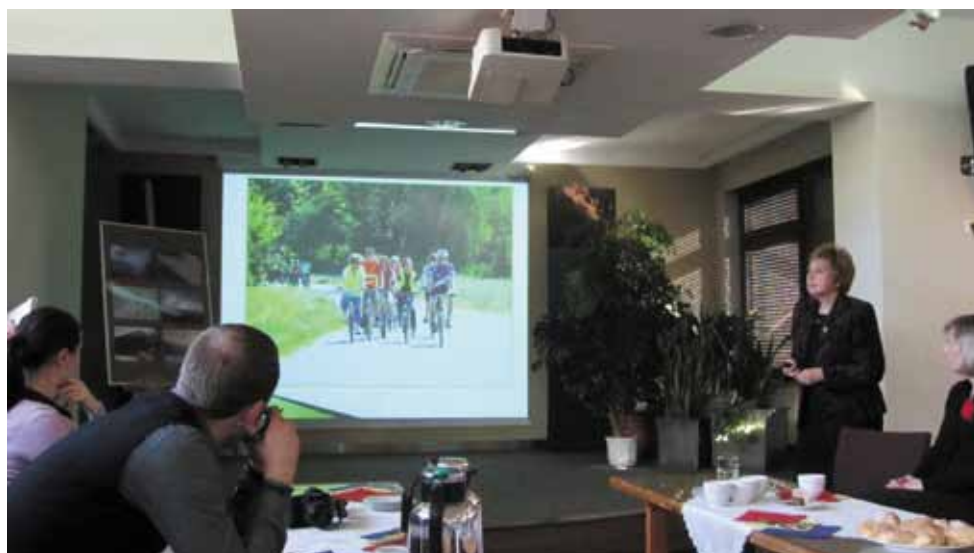
Biblioteca din orașul Nowy Tomysl

O bună parte din tipurile de activități derulate în Polonia le desfășurăm și noi în România, dar numai câteva ies din tiparul celor știute de noi: concursuri în presa locală, concursuri de biciclete, activități în aer liber cu adolescenții, copiii și seniorii etc. Bibliotecarii polonezi nu se laudă cu numărul de cărți achiziționate, nu fac o statistică a activităților derulate sau a parteneriatelor încheiate. Atmosfera