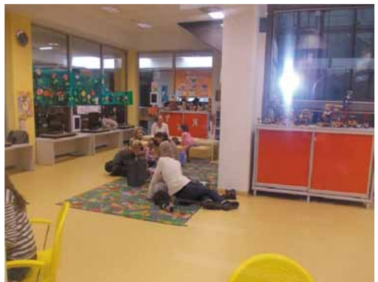
Spațiul de joacă și interacțiune pentru copiii, familii și educatori, Mediateca Start-Meta din Varșovia, cartierul Bielany