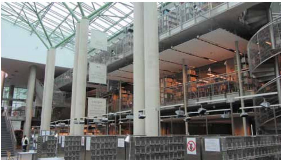
Biblioteca Universității din Varșovia

Orașul Jarocin, a cărui bibliotecă am vizitat-o, are o populație de 72000 de locuitori, iar Biblioteca Raională a fost înființată în 1943. Aceasta are 9 filiale care sunt plasate lângă primărie,