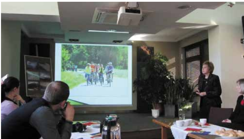
Biblioteca din orașul Nowy Tomysl

O bună parte din tipurile de activități derulate în Polonia le desfășurăm și noi în România, dar numai câteva ies din tiparul celor știute de noi: concursuri în presa locală, concursuri de biciclete, activități în aer liber cu adolescenții, copiii și seniorii etc. Bibliotecarii polonezi nu se laudă cu numărul de cărți achiziționate, nu fac o statistică a activităților derulate sau a parteneriatelor încheiate. Atmosfera