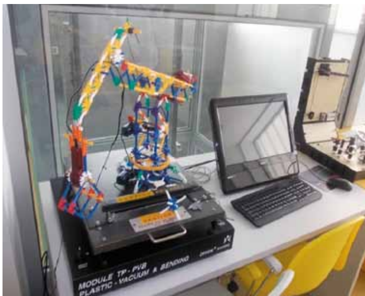
Sala de experimente tehnice, Mediateca Start - Meta din Varșovia, cartierul Bielany

Data de 19 octombrie 2006 a marcat dezvelirea oficială a monumentului lui Jan Nowak-Jerozolinsky, numele renumitului om fiind o mare onoare și distincție pentru bibliotecă, și deschiderea Bibliotecii și Centrului