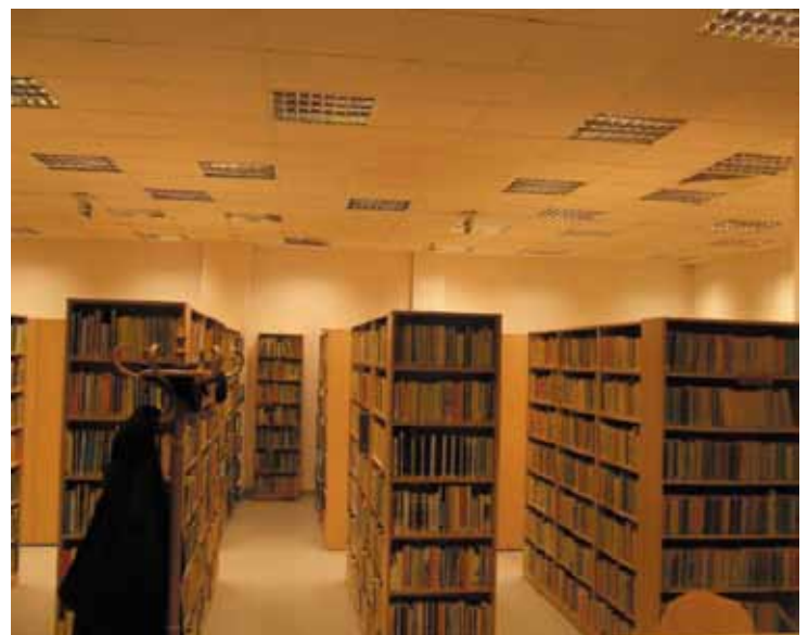
Biblioteca publică Jan Nowak-Jerozolimski, Varșovia - secția de împrumut